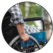
SILLA DE RUEDAS